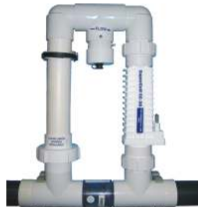
Patented bypass (not included)

Patentovaný systém potrubního rozvodu (nutno připočíst)